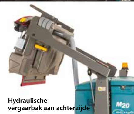
Hydraulische vergaarbak aan achterzijde

▶ Dura-Track™ parabolisch dweilframe met SmartRelease™ levert uitzonderlijke wateropname en vermindert onderhoud en vervanging van onderdelen wegens schade aan het dweilframe.