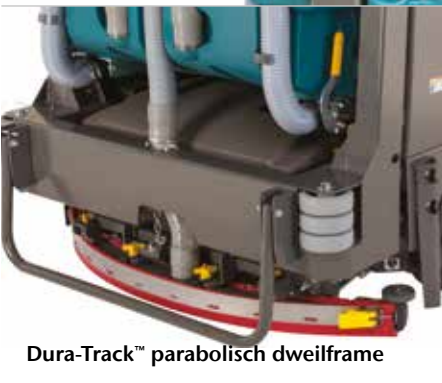
Dura-Track™ parabolisch dweilframe

▶ Gele, gemakkelijk te herkennen aanraakpunten voor onderhoud besparen tijd en geld op routineonderhoud.