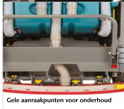
Gele aanraakpunten voor onderhoud

Beschermkap beschermt gebruikers tegen vallende voorwerpen.