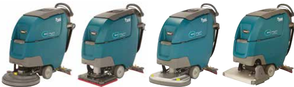
Eén schijf: 430 mm & 500 mm

De T300 schrobzuigmachines beschikken over meerdere koppen die beantwoorden aan uw reinigingsbehoeften en een optimale reiniging mogelijk maken.