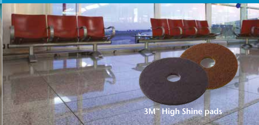
3M™ High Shine pads